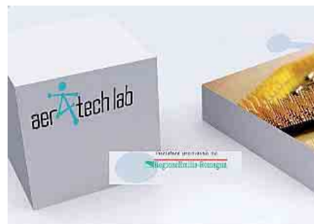
Il portale Aer-tech Lab

vazioni applicabili all'industria elettronica, dell'automazione, a quella informatica e delle telecomunicazioni, fino alle realtà specializzate dell'ingegneria biomedica. Dal canto suo, Innovami si pone come partner strategico per la promozione di queste innovazioni presso imprese, istituzioni ed enti potenzialmente interessati ai risultati delle ricerche in questi settori, in Emilia-Romagna e non solo. Partner di Aer-tech sono dieci strutture di ricerca pubblica e privata, quattro imprese (anche IMA e Sacmi) e una Onlus.