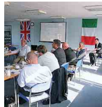
Il meeting Ita-En